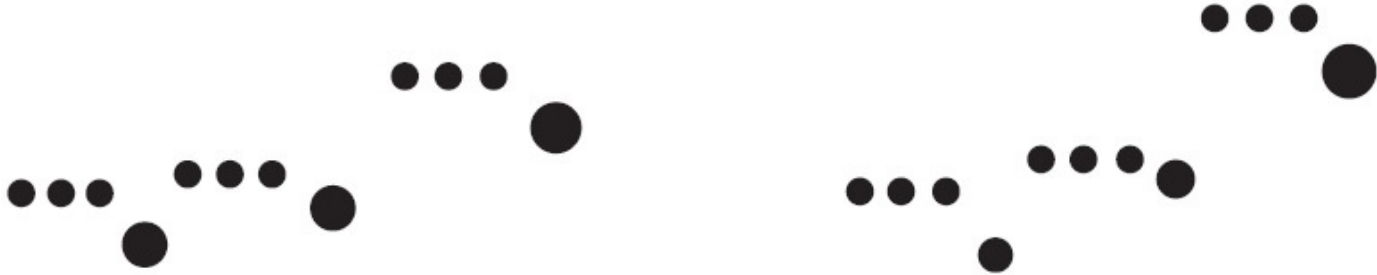
Lo mismo, traducido a puntos